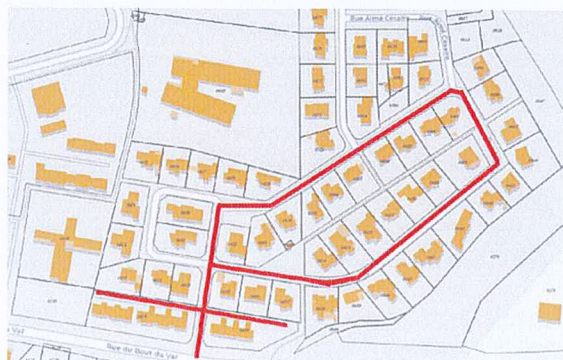
Rue Gisèle HALIMI

A l'issue de réunions d'information ayant donné lieu à des échanges avec les habitants de cette rue, il est proposé de la renommer : rue Gisèle Halimi.