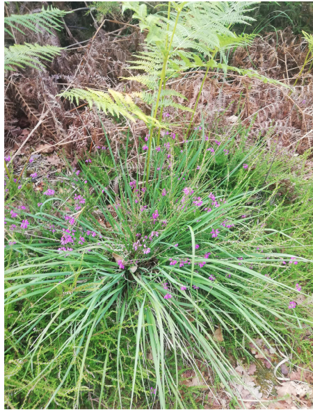
Bruyère dans la Lande du Gras