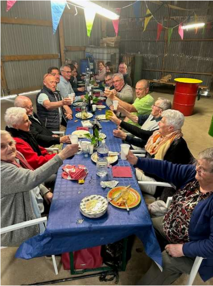
Repas de quartier de Bourchonnet