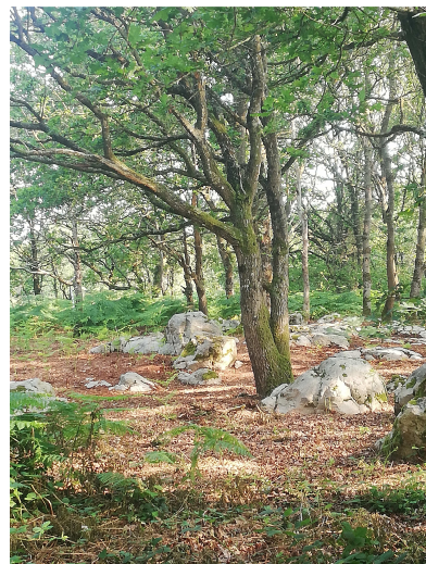
La Lande du Gras