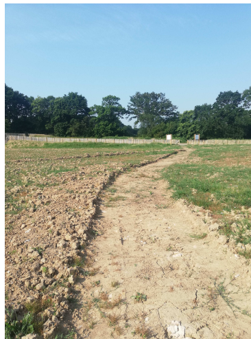
Renaturation de l'ancien terrain de foot