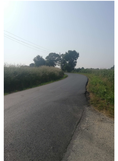
Réfection du dernier tronçon de route entre Le Champ Sort et Lauverdet d'En Bas