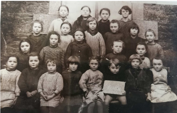
Ecole de Meslin 1930