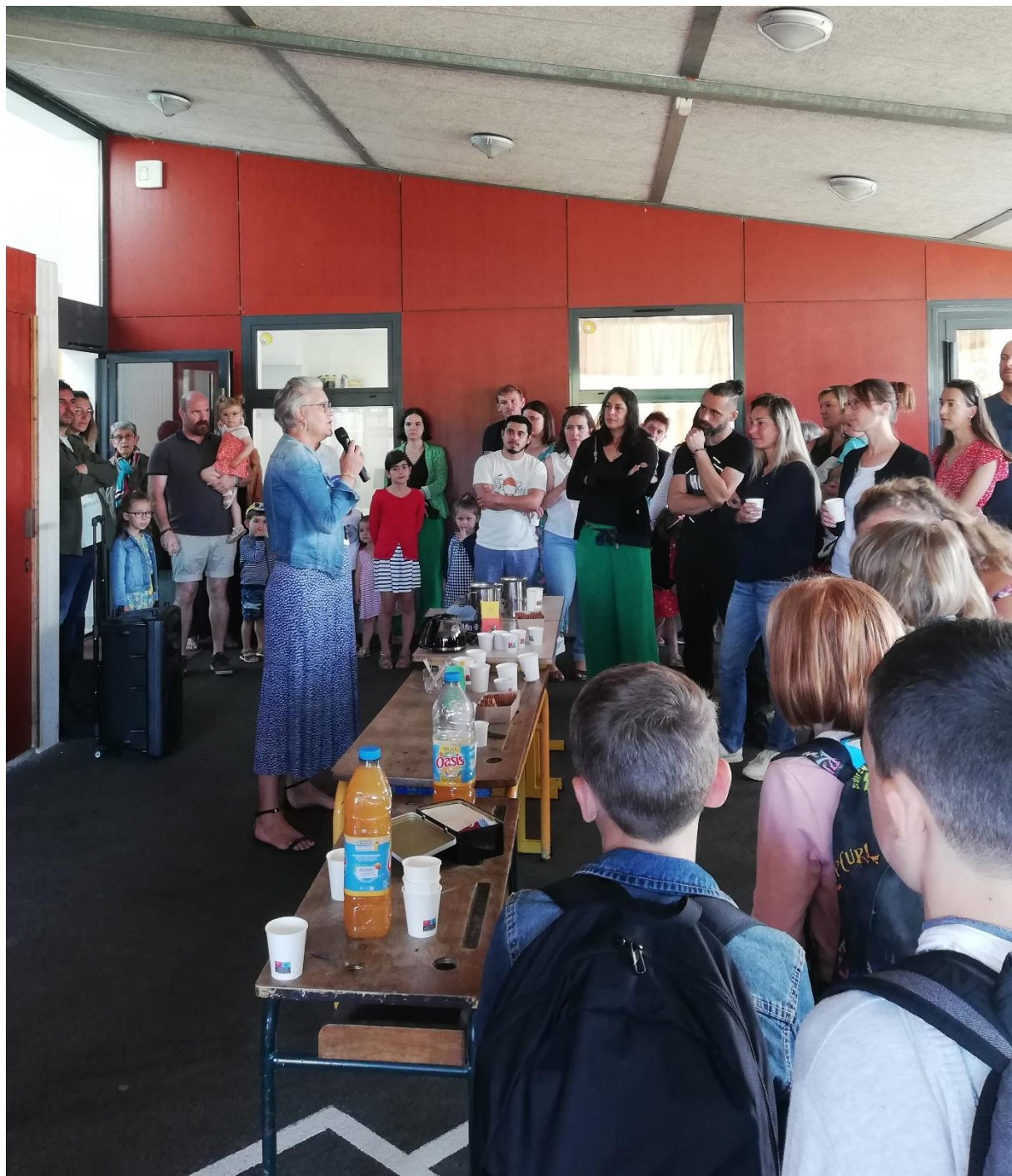
Pot d'accueil de l'école des Pensées - rentrée scolaire du 4 septembre 2023